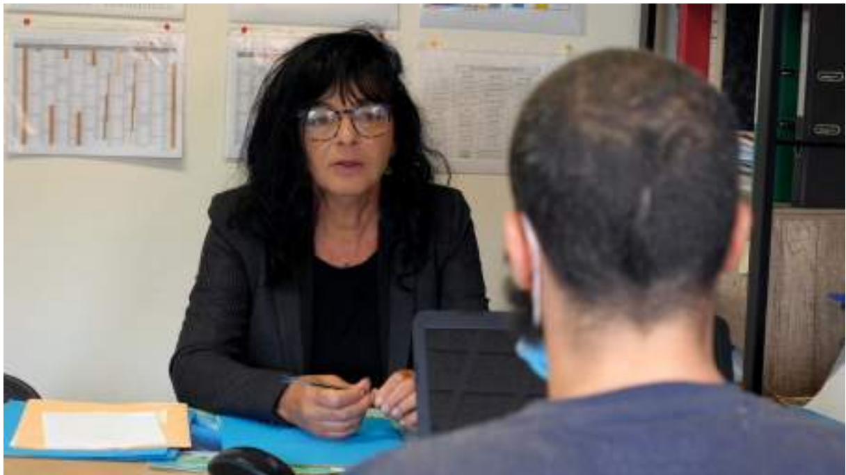
Dossier de presse du documentaire « Au nom de la loi, je vous libère... » de Nathalie PLICOT / Massala / A Prime Group / 2021